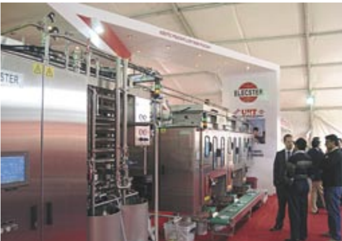
Delhissä osastomme valittiin IDA 2012 messujen parhaaksi.