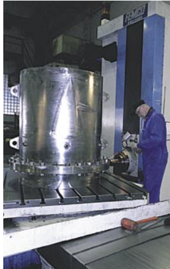
A/S Eesti Elecster on merkittävä alihankkija myös emoyhtiölle.

Vuoden 2012 aikana pääpaino oli tuotannon tehokkuuden kehittämisessä sekä tuotannon ohjausjärjestelmän parantamisessa. Kehitystyöllä onnistuttiin parantamaan entisestään tuotannon tehokkuutta ja toimitusvarmuutta kilpailukyvyyn varmistamiseksi tulevaisuudessakin.