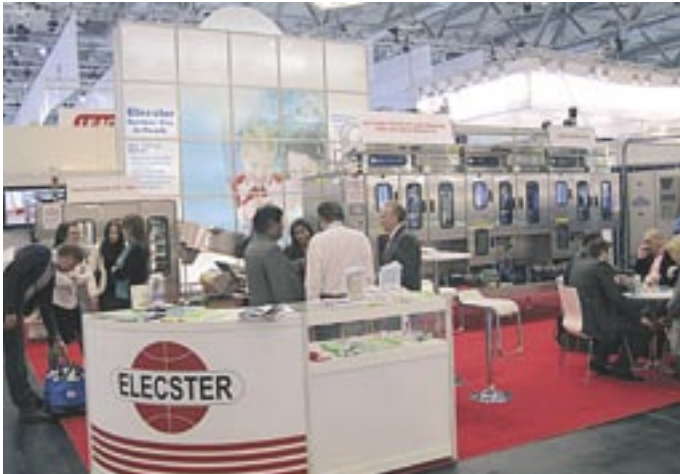
Kölnissä Anuga FoodTech- messuilla vieraili asiantuntijoita yli 130 maasta.