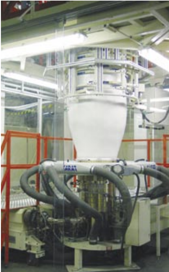
Monikerroskalvon valmistamista Elecsterin Reisjärven tehtaalla.

Pakkausmateriaalit-tuoteryhmän tuotantolaitokset sijaitsevat Reisjärven lisäksi Permissä, Venäjällä ja Tianjinissa, Kiinassa. Reisjärven yksikkö toimittaa nestemäisten maitotuotteiden pakkausmateriaaleja Afrikkaan, Eurooppaan ja Etelä-Amerikkaan. Kuluneen vuoden aikana toimitukset etenkin Afrikkaan kasvoivat. Permin tehtaan tuotanto on suunnattu venäjänkielisille alueille. Tianjinin tehtaan markkina-alue on lähinnä Kiina ja muut Aasian maat.