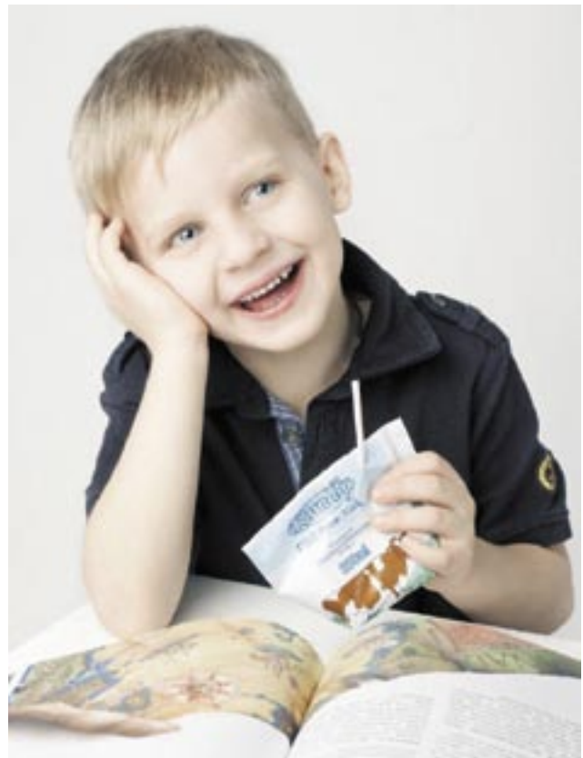
Finnpack toimittaa Elecsterin pakkauskoneita venäjänkielisiin maihin.