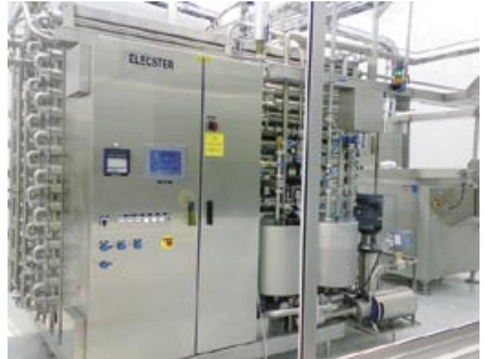
Sterilisaattori varmistaa maidon säilyvyyden ilman lisäaineita.

Iskukuumennettu maito aseptisesti pakatussa pussissa ei tarvitse kylmäketjua. Sen säilyvyys ilman lisäaineita huonelämpötilassa on useita kuukausia. Pakkausmateriaalien ja -koneiden kehitys on mahdollistanut taloudellisen, kestävä ja hyvin säilyvän kuluttajapakkausten luomisen.