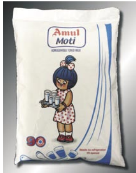
Intia on maailman suurin maidontuottaja. Markkinajohtaja Amul toi markkinoille Elecster UHT-maidon.