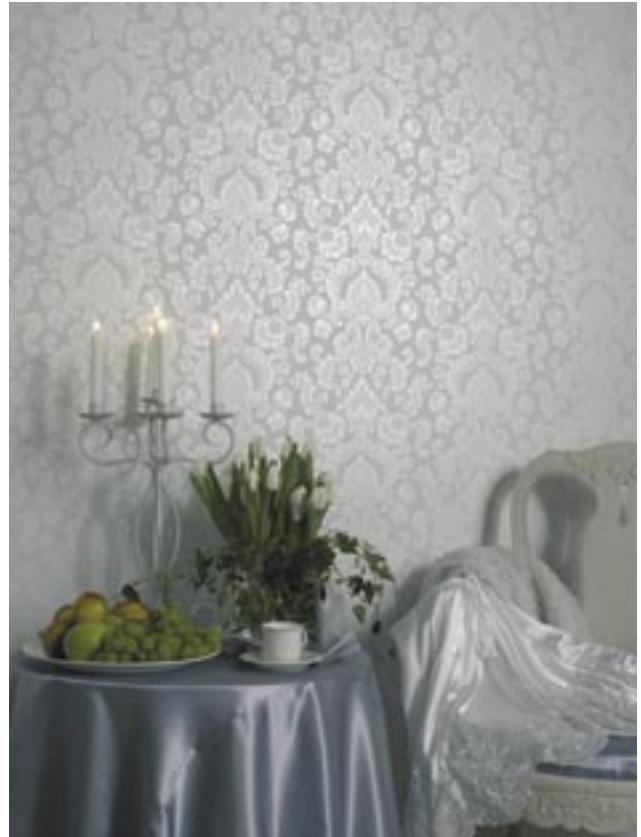
Sandudd jatkaa perinteitä suomalaisessa tapetinvalmistuksessa.

Tavoitteenamme on strateginen kumppanuus asiakkaan kanssa, mikä mahdollistaa meijerien tehokkaan, vakaan ja luotettavan toiminnan. Pyrimme ennakoimaan alan uusia trendejä ja soveltamaan ne asiakkaidemme käyttöön mahdollisimman nopeasti.