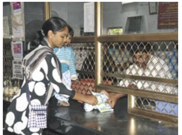
Iskukuumennus poistaa kylmäketjun tarpeen jakelusta.