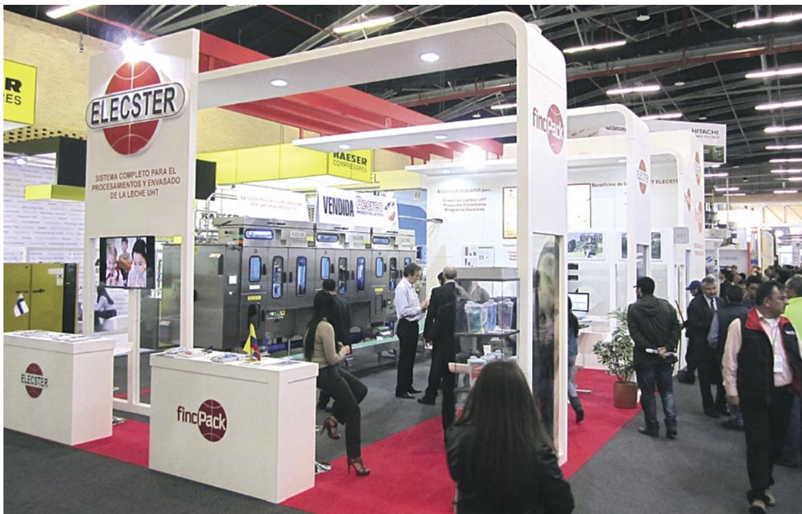
Elecster oli näyttävästi esillä Bogotan Andinapack 2013 messuilla.