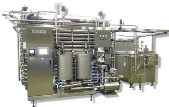
Uudessa EL-10800:ssa riittää tuotantokapasiteettia isommallekin meijerille.