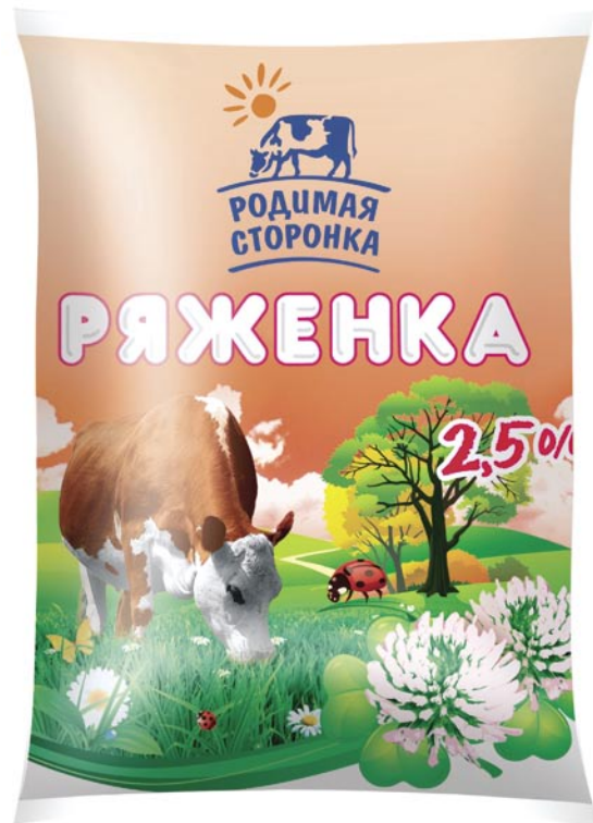
Finnpack-järjestelmä on meijerille kaikenkattava ratkaisu.