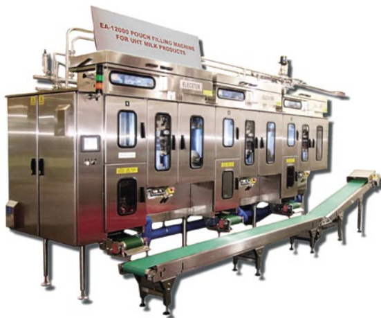
EA-12000 on markkinoiden nopein aseptinen pussikone.

Elecster toimii pääasiassa kehittyvillä markkinoilla, joissa maidon jakelu on hankalaa kuuman ja kostean ilmaston vuoksi. Monessa väkirikkaassa maassa on lisäksi alikehittynyt infrastruktuuri ja huonot liikenneyhteydet. Pakattu maito on kuitenkin yksi tärkeimpiä elintarvikkeita paikallisten perheiden ostoskoreissa.