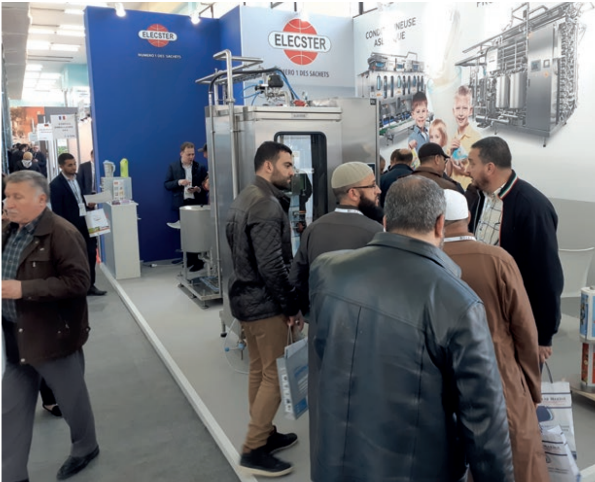
Elecster Djazagro messuilla Algeriassa, Algerissa.