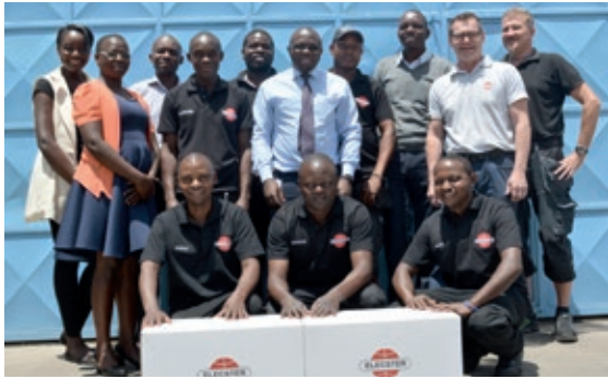
Elecster Kenya Ltd.:n henkilöstö