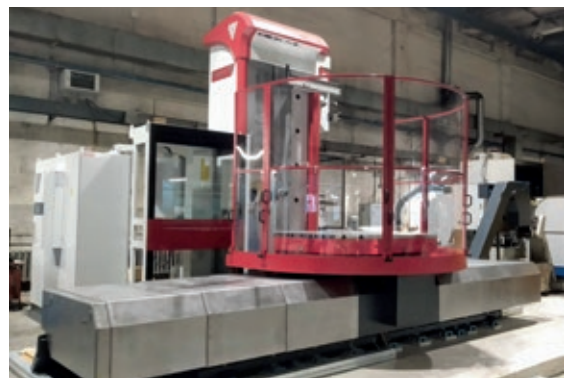
Uusi työstökonekone Fermat WTF 11 CNC Eesti Elecsterin tiloissa.

Eesti Elecster onkin onnistunut kasvattamaan tilauskantaa ja vakiinnuttamaan paikkansa merkittävien skandinaavisten koneerakentajien alihankintakonepajana.