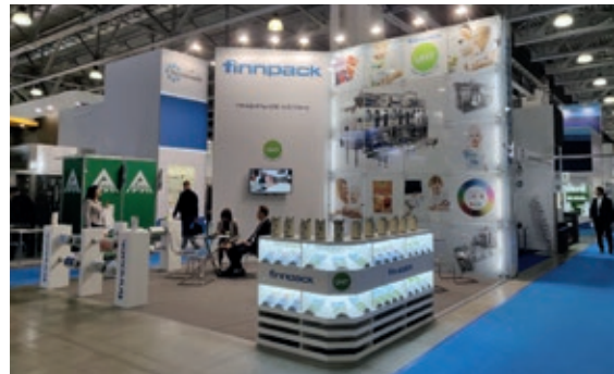
Finnpack näyttävästi esillä Moskovian messuilla.

Permin kalvotehaalla on aloitettu tehtaan laajennustyöt. Uuden flexopainokoneen myötä tilat ovat käyneet ahtaiksi, mikä on osoittanut tarpeen laajentaa tehdastiloja 2300 m 2 :n verran. Laajennustyö on valmis vuoden 2019 loppuun mennessä. Toiminnan aloitus ja painetun kalvon varastointi uusissa tiloissa on määrä aloittaa maaliskuussa 2020.