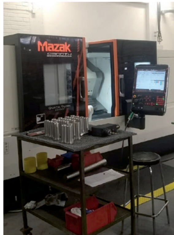
Reisjärven tehtaan uusi 4-akselinen CNC-työstökone.

Kalvopuolella Reisjärven tehtaalla on tapahtunut tuotekehityksessä huomattavaa edistystä. Nykyisten yhden ja kolmen kuukauden säilyvyyden takaavien pakkauskalvojen rinnalle on kehitetty vuoden kuukauden säilyvyyden takaava kalvo. Uusi 6kk-kalvo parantaa asiakkaidemme maidon säilyvyyttä haastavissakin olosuhteissa, varmistaen, että jokainen loppiasiakas saa turvallista maitoa.